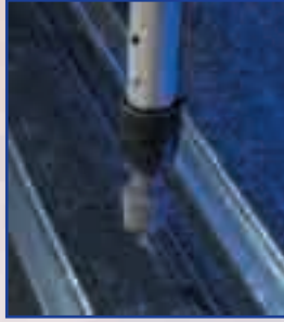
Perfore los orificios en la plataforma