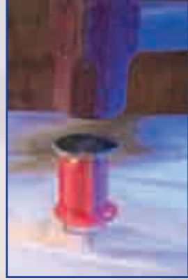
Martille el inserto