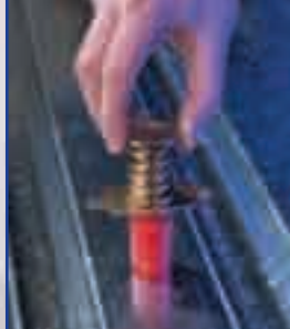
Inserte el Bang-It en su lugar