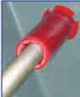
Vacíe el concreto y luego instale la varilla