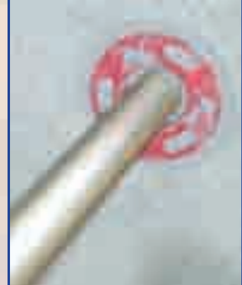
Instale la varilla