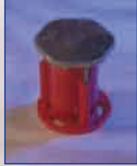
Vacíe el concreto