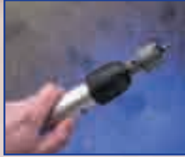
Fije en el mandril la sierra de carburo para orificios

Nota: La aprobación UL para el Bang-it de 1/2" se refiere únicamente a la cresta de la plataforma metálica.