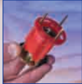
Coloque el Wood-Knocker en su lugar

Nota: La aprobación UL para el inserto Wood-Knocker de 5/8" es para tubos de 8" como máximo.