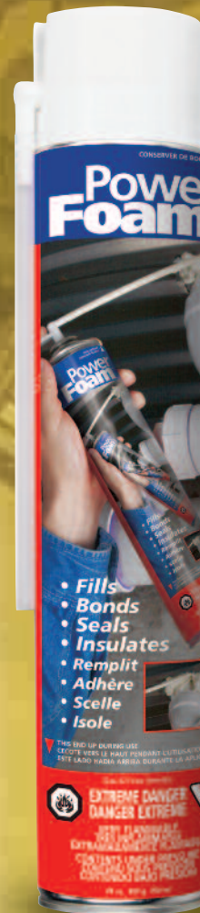
Espuma de 12 oz. para aplicación con tubo