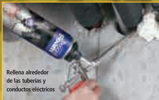
Rellena alrededor de las tuberías y conductos eléctricos