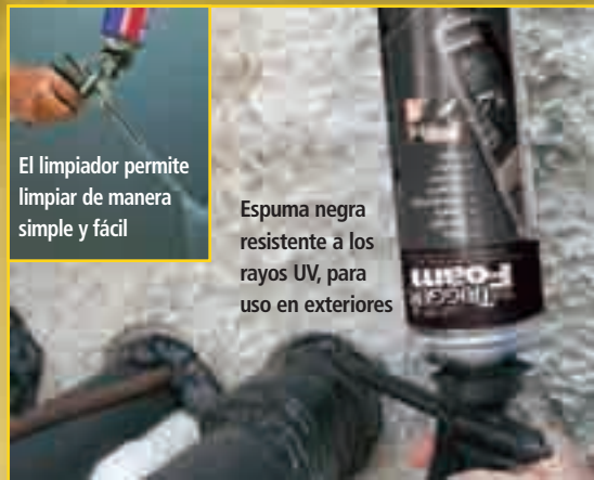
El limpiador permite limpiar de manera simple y fácil