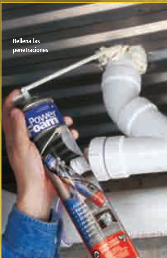
Rellena las penetraciones